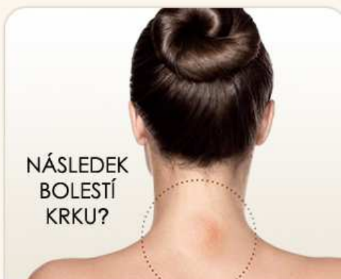
NÁSLEDEK BOLESTÍ KRKU?