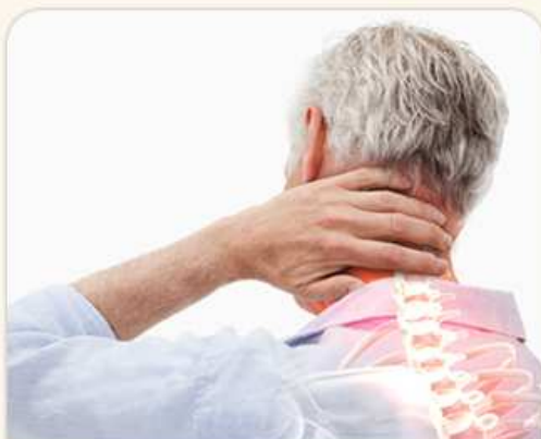
BOLEST VE VYŠŠÍM VĚKU