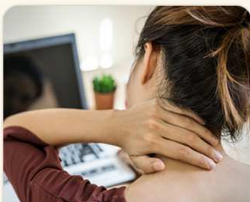
DLOUHÁ PRÁCE U POČÍTAČE