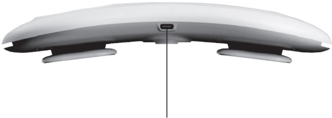
Zdíčka pro připojení USB kabelu