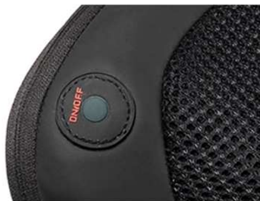
ovládání pomocí jednoho tlačítka