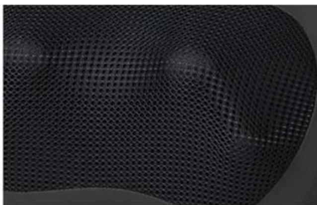
vzdušná a pevná tkanina