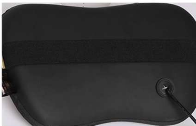
vysoce kvalitní koženka s dlouhou životností