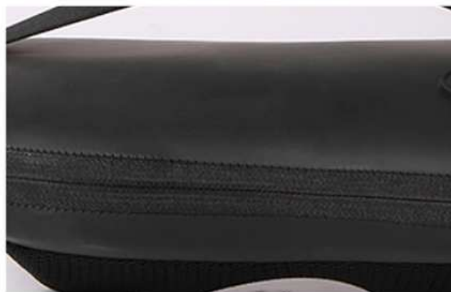
precizní kvalita šití